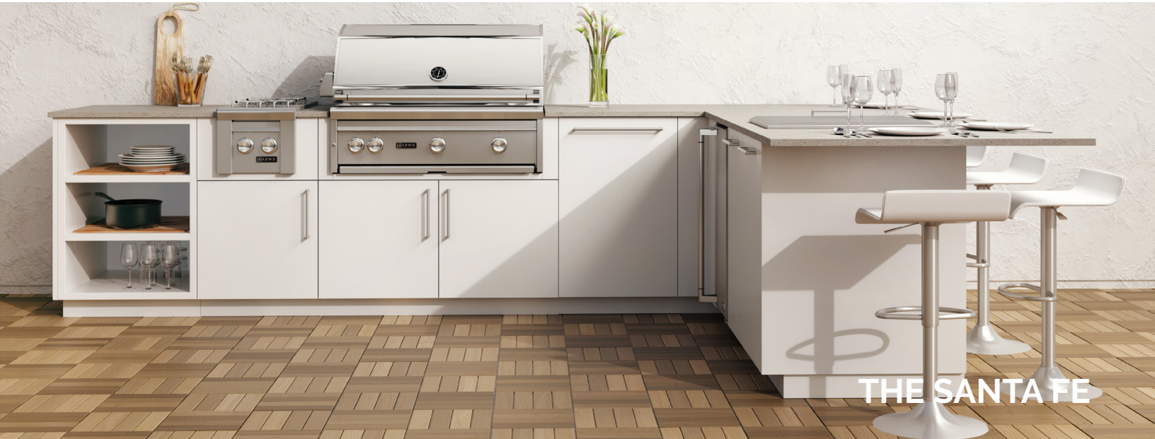
THE SANTA FE